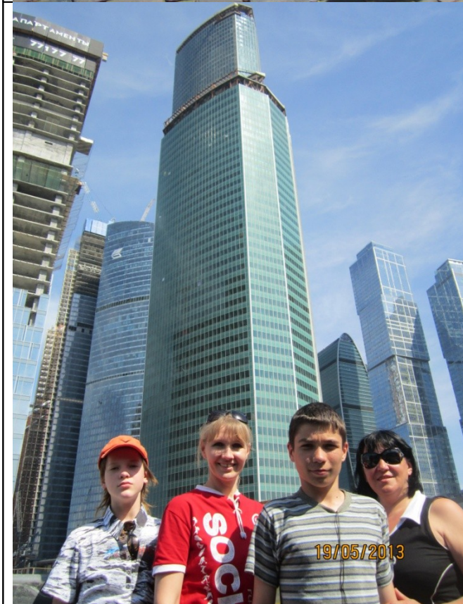
В городе будущего.