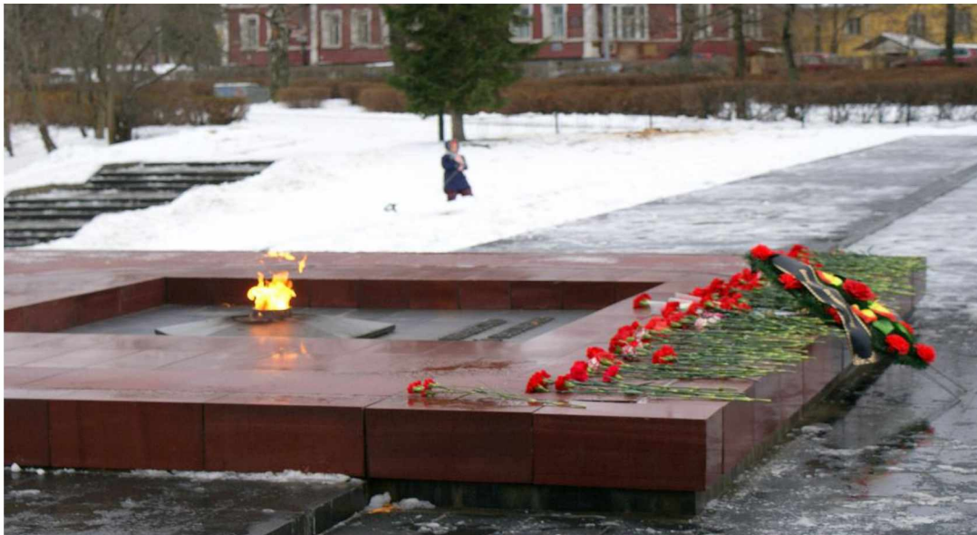
Материал подготовили сотрудники школьного музея.

Всего в войнах и вооруженных конфликтах 20 и 21 веков пропали без вести примерно два миллиона советских и российских граждан. И каждый год работа по поиску и установлению неизвестных и пропавших без вести защитников Отечества продолжается. А слова «Никто не забыт, ничто не забыто» стали символом этого памятного дня. И в честь праздника по всей стране в этот день проходят различные памятные и торжественные мероприятия, церемонии возложения цветов к мемориалам павшим воинам и воинским захоронениям с участием ветеранов, военнослужащих, представителей власти.